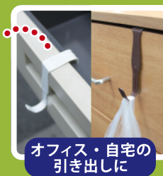
オフィス・自宅の 引き出しに